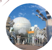
藤沢市湘南台文化センター