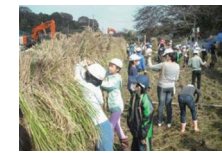
地産地消の取組 (いずみ野小学校)