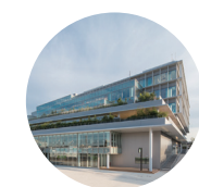
大和市文化創造拠点シリウス