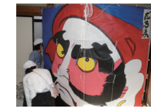
伝統文化学習 (中和田南小)