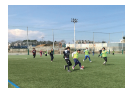
神奈川県サッカー協会 フットボールセンター(かもめパーク)

区内には、サッカー、フットサル、テニスなどのスポーツ施設も充実しています。仲間と一緒に汗をかくことで、いっそう爽快感が味わえます。