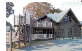
いずみ台公園こどもログハウスげんきっこ

駅から近いこどもログハウスは人気の施設。近くには図書館もあります。足を延ばせば近隣には文化施設も充実。お子さんとのおでかけにもぴったりですね。